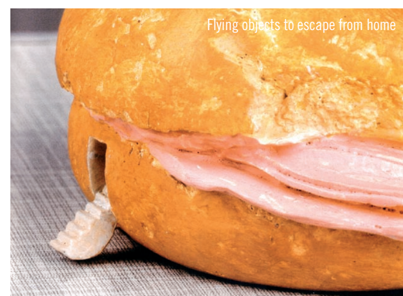
Flying objects to escape from home