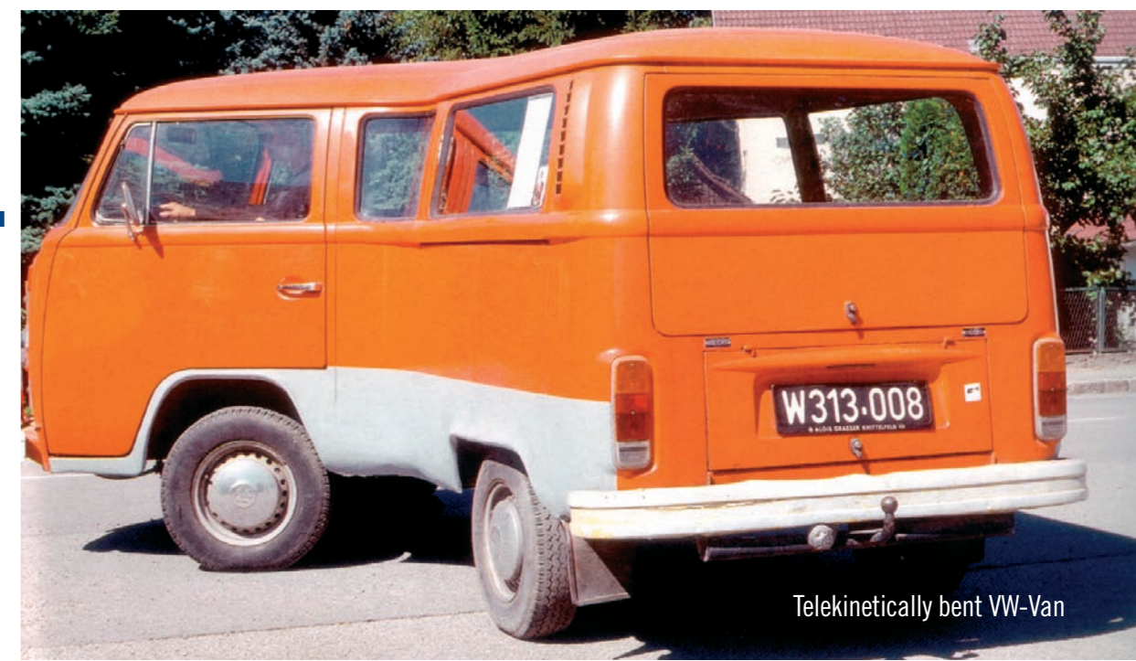
Telekinetically bent VW-Van