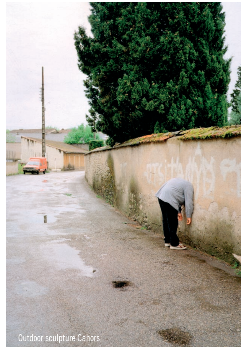
Outdoor sculpture Cahors

Erwin Wurm gilt als einer der erfolgreichsten Künstler am internationalen Kunstmarkt. Bekannt wurde er erstmals durch seine „one minute sculptures“, bei denen er Menschen mit Alltagsgegenständen posieren lässt, um sie dann zu fotografieren. Ebenfalls populär geworden sind seine „Fat“-Sculptures, durch die kleinbürgerliche Statussymbole wie Autos oder Einfamilienhäuser in einem verfetteten Zustand gezeigt werden. „Achtzig“ besuchte den gebürtigen Steirer in seinem Atelier in Wien, um mit ihm über Humor, Bewusstseinszustände, spannende Kunst und die erst kürzliche Zusammenarbeit mit dem Luxuslabel „Hermès“ zu sprechen.