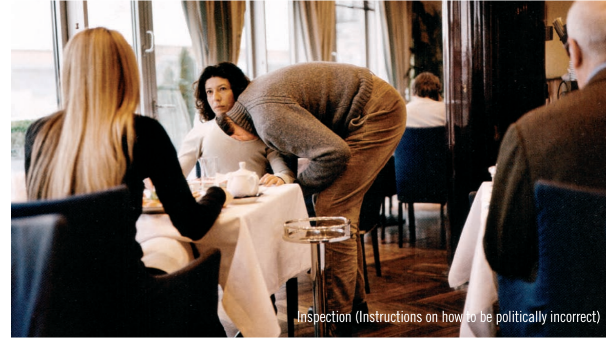
Inspection (Instructions on how to be politically incorrect)

Geld ist für mich nicht anbetungswürdig, aber es ist angenehm es zu haben. Viele Dinge lassen sich dadurch realisieren, vor allem in Bezug auf die Verwirklichung meiner Kunstwerke. SZ